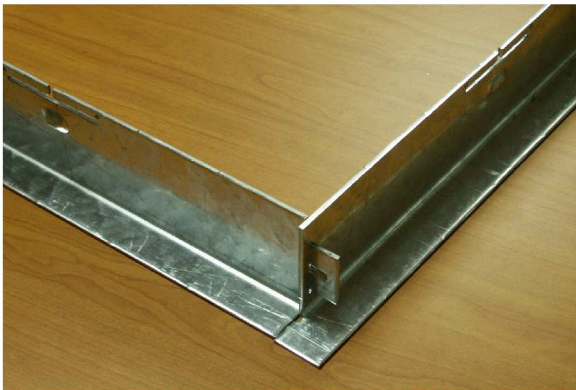
3 - Placer les tenons dans les mortaises afin de former le cadre.