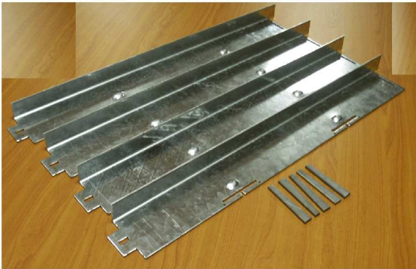
1 - Le Kit est constitué de 4 traverses et 5 clavettes (1 de plus que nécessaire).