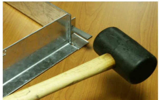
4 - Une fois le cadre constitué, engager les clavettes (au marteau) suivant la figure ci dessus.