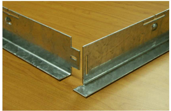
2 - Présenter les traverses suivant la figure ci dessus.