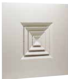
AN 704 TP

Le AN 704 TP est un diffuseur carré pour dalle de plafond avec 4 directions de soufflage pour la diffusion d'air dans les locaux tertiaires.