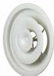
A842 D630 RAL9010-30%

Le A 842 est un diffuseur de soufflage circulaire réglable par vis pour la diffusion d'air dans les bâtiments tertiaires.