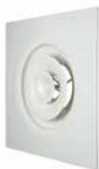
A842 TP D200 AXB 600X600 RAL9010-30%

Le A 842 TP est un diffuseur de soufflage circulaire réglable par vis pour la diffusion d'air dans les bâtiments tertiaires.