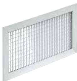
Grille AC 123

La grille murale AC 123 en aluminium permet la reprise d'air dans un local pour des installations de ventilation ou de conditionnement d'air.