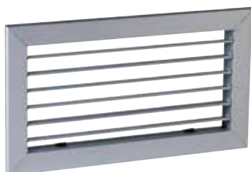
AC 101 F3 200X100

La grille murale AC 101 en aluminium permet la reprise d'air dans un local pour des installations de ventilation ou de conditionnement d'air.