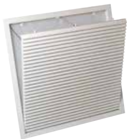
Grille AG 637

La grille en plafond ouvrante en aluminium avec filtre AG 637 permet la reprise d'air pour des systèmes de ventilation ou de conditionnement d'air.