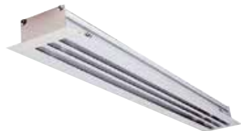
Diffuseur ALD 610 - 620