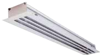
Diffuseur ALD 610 - 620