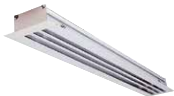
ALD613 1500 ALU + DAMPER

Le ALD 610 - 620 est un diffuseur linéaire en aluminium à fentes fixes pour la diffusion ou la reprise d'air dans les bâtiments tertiaires.