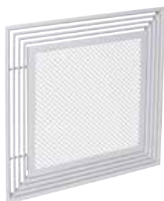
ALD614K AxB 675x675 COMBINED

L'ALD 610 K Combined est un diffuseur carré multi-fentes 4 directions pour la diffusion et la reprise d'air combinées dans les bâtiments tertiaires.