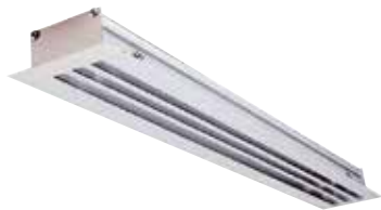
Diffuseur ALD 610 - 620