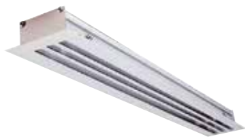
Diffuseur ALD 610 - 620

Le ALD 610 - 620 est un diffuseur linéaire en aluminium à fentes fixes pour la diffusion ou la reprise d'air dans les bâtiments tertiaires.