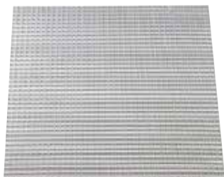
Grille AO 123

La grille de plafond en aluminium AO 123 permet la reprise d'air dans un local pour des installations de ventilation ou de conditionnement d'air.