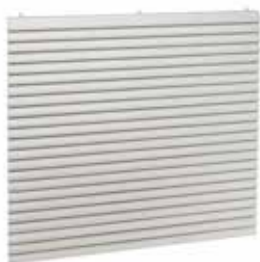
AO251 F0 AXB=600X600 ANOD

La grille de plafond en aluminium AO 251 permet la reprise d'air dans un local pour des installations de ventilation ou de conditionnement d'air.