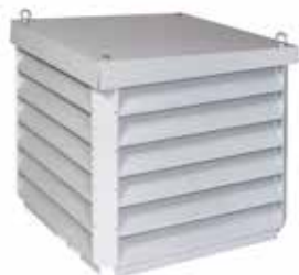
AP 639 H 800 EDICULE TOITURE ALU

L'édicule de toiture AP 639 assure la prise d'air neuf ou le rejet d'air vicié des systèmes de ventilation et de désenfumage.