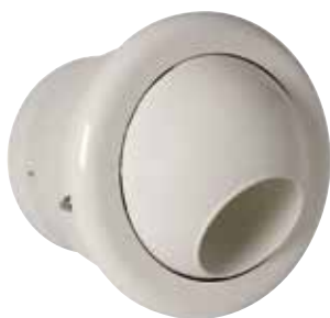
AR 190 THERMO D200 RAL9010-85%

L'AR 190 Thermo est un diffuseur à longue portée pour la diffusion d'air dans les bâtiments tertiaires avec une grande hauteur sous plafond.