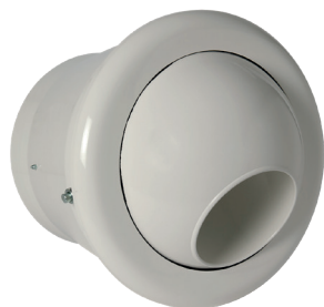
AR 190 THERMO D200 RAL9010-85%

L'AR 190 Thermo est un diffuseur à longue portée pour la diffusion d'air dans les bâtiments tertiaires avec une grande hauteur sous plafond.