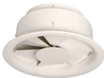
Diffuseur AR 883

L'AR 883 est un diffuseur à haute induction à jet d'air hélicoïdal pour la diffusion d'air dans les bâtiments tertiaires grande hauteur sous plafond.