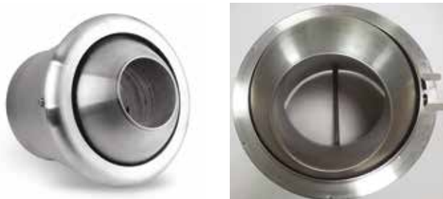
AR 190 THERMO D200 ALU

L'AR 190 Thermo est un diffuseur à longue portée pour la diffusion d'air dans les bâtiments tertiaires avec une grande hauteur sous plafond.