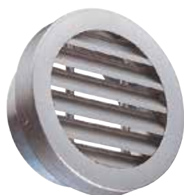
AR637 F0 D200

La grille extérieure circulaire murale AR 637 permet la prise d'air ou le rejet d'air vicié sans risque d'entrée de pluie grâce à la forme des ailettes.