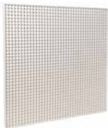
Grille AU 124

La grille de plafond en aluminium AU 124 permet la reprise d'air dans un local pour des installations de ventilation ou de conditionnement d'air.