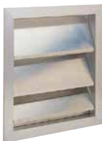
AVF75 500X500 V/DEPRESS

Le volet mural anti-retour AVF 75 permet la mise en dépression d'un local.