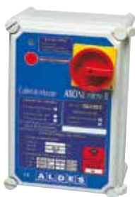
Coffret AXONE TO Modèle 1 vitesse (4,7 A et 16,7 A)

AXONE Micro II 1V/DES est un coffret de relaying précâblé et certifié NF permettant de piloter des ventilateurs de désenfumage.