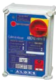
Coffret AXONE 1V/DES-Tri 16.7+IPDP T1

AXONE Micro II 1V/DES est un coffret de relaying précâblé et certifié NF permettant de piloter des ventilateurs de désenfumage.