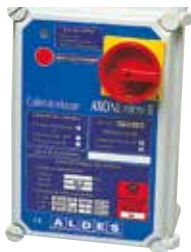
Coffret AXONE T0 Modèle 1 vitesse (4,7 A et 16,7 A)