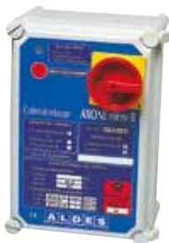
Coffret AXONE 1V/DES 16.7A TRI 230 T1

AXONE Micro II 1V/DES est un coffret de relaying précâblé et certifié NF permettant de piloter des ventilateurs de désenfumage.