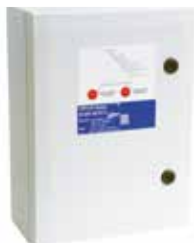
Coffret de puissance AXONE T2