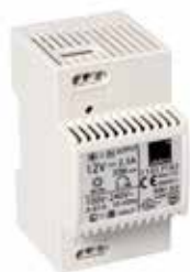
Module Pilot Mod

Le Pilot Mod est le cerveau du système VMT qui régule le débit d'air des locaux selon l'occupation pour une bonne QAI et une faible perte énergétique.