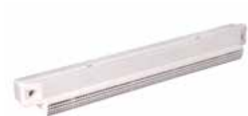
Auvent acoustique anti insecte

Auvent acoustique anti insecte pour EHL, EA, EHB2 - Blanc