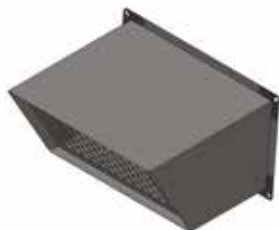
Auvent pare-pluie VEX