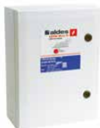
Coffret AXONE Démarrage progressif 1 Vitesse (25,4 A).

AXONE Micro III 1V/DES - D.PROG est un coffret de relaying précâblé et certifié NF permettant de piloter des ventilateurs de désenfumage.