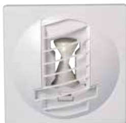
Bap Color - blanc

La bouche BAP COLOR Standard Fixe est idéale pour les logements en rénovation, elle permet de garantir un débit d'air constant en permanence quelles que soient les conditions dans le logement.