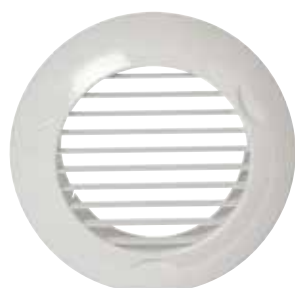
Grille BIP D 80 mm

BIP et BIO sont les grilles de ventilation fixe destinées aux maisons individuelles et logements collectifs.