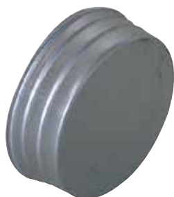
Bouchon Mâle Femelle en aluminium

Le bouchon mâle femelle alu permet de boucher un conduit ou un accessoire en aluminium dans les locaux tertiaires et les logements collectifs.