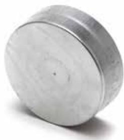
Bouchon Mâle Femelle

Le Bouchon Mâle Femelle permet de boucher un conduit ou un accessoire en acier galvanisé dans les locaux tertiaires et les logements collectifs.