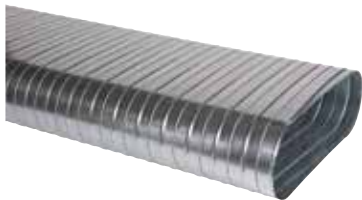
Conduits Spirales Rigides Oblongs

Le conduit galvanisé oblong est une alternative performante aux réseaux rectangulaires permettant le passage de gros débits d'air en espace réduit.