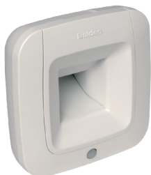
Bouche BW84 BDH

La bouche BDH régule l'air selon l'humidité, assurant une ventilation économe et efficace pour un air sain, idéale pour vos projets tertiaires