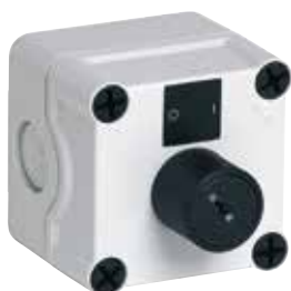
Boîtier de réarmement AXONE

Boîtier de réarmement à clé AXONE - contact non maintenu