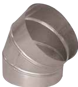
Coude 45° en aluminium

Le coude 45° alu permet de changer la direction d'un réseau aluminium de 45°.