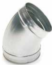
Coude 45° embouti

Le coude 45° permet de changer la direction d'un réseau galvanisé de 45°.