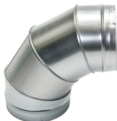
Coude 90° secteur

Le coude 90° permet de changer la direction d'un réseau galvanisé de 90°.