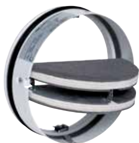
Cartouche coupe-feu CF1/ CF2

La Cartouche Coupe-feu CF1/CF2 fait partie de la gamme de clapets terminaux coupe-feu à destination des bâtiments tertiaires et industriels.