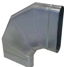
Coude Horizontal Oblong 90°

Le coude horizontal oblong 90° permet de changer la direction d'un réseau oblong de 90° dans le plan du réseau.