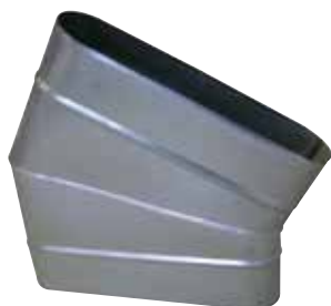
Coude Horizontal Oblong 30°

Le coude horizontal oblong 30° permet de changer la direction d'un réseau oblong de 30° dans le plan du réseau.