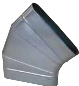
Coude Horizontal Oblong 45°

Le coude horizontal oblong 45° permet de changer la direction d'un réseau oblong de 45° dans le plan du réseau.