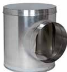
Caisson Piquage Acoustique et Aéraulique en aluminium