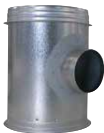
Caisson Piquage pour relevé d'étanchéité

Le caisson piquage pour relevé d'étanchéité permet de joindre et de rendre accessible le réseau collecteur vertical et le réseau horizontal.