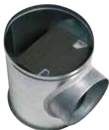
Caisson Piquage Acoustique et Aéraulique en aluminium

Le CP2A alu assure la jonction et l'accessibilité du réseau collecteur vertical et du réseau horizontal en améliorant l'acoustique et l'aéraulique.