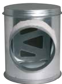
Caisson Piquage Acoustique et Aéraulique

Le CP2A assure la jonction et l'accessibilité du réseau collecteur vertical et du réseau horizontal en améliorant l'acoustique et l'aéraulique.