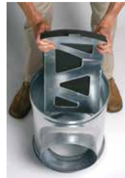
Installation du déflecteur acoustique et aéraulique dans le caisson piquage