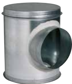
Caisson Piquage Acoustique et Aéraulique